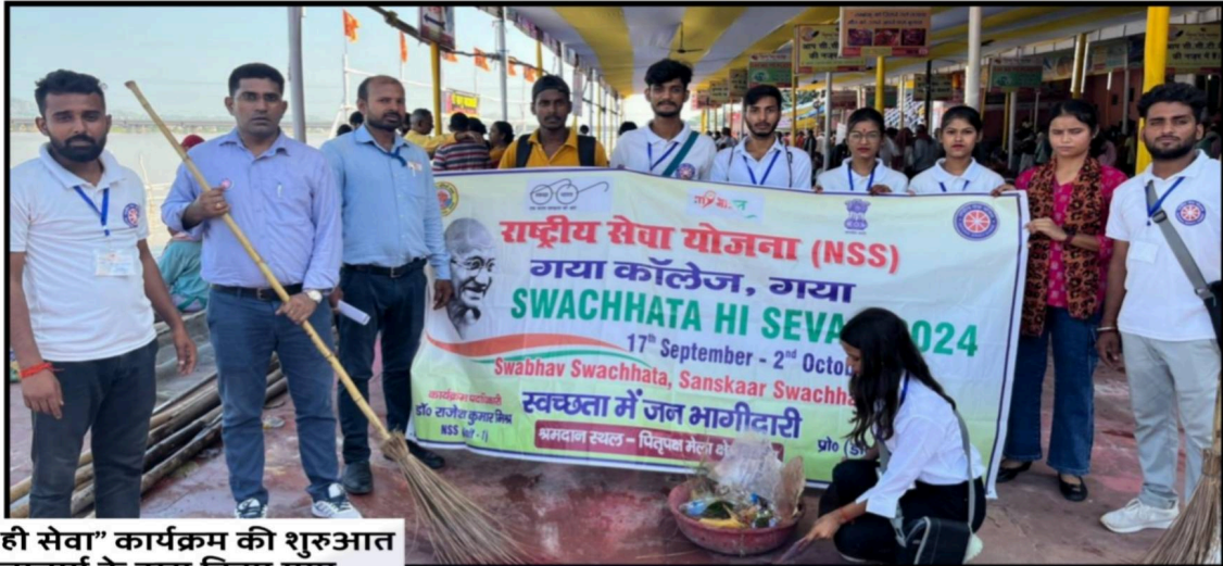
“स्वच्छता ही सेवा” कार्यक्रम की शुरुआत प्रधानाचार्य के द्वारा किया गया